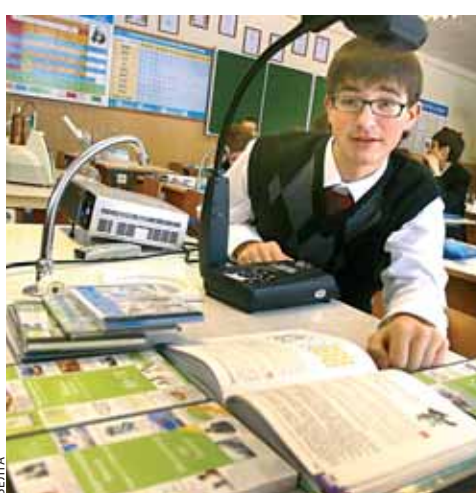
На ўроку хіміі ў мінскай гімназіі № 13

Пагадненне ў галіне адукацыі было заключана паміж Мінскім гарадскім інстытутам развіцця адукацыі і адміністрацыяй горада Берліна ў 2008 годзе. Першыя два гады беларускія педагогі наведвалі нямецкія ўстановы адукацыі. І вось адбыўся першы візіт у Беларусь групы нямецкіх педагогаў.