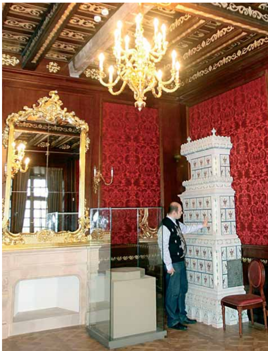
Нясвіжскі замак пасля рэстаўрацыі варта пабачыць і суайчыннікам, і замежнікам

Дарэчы, Міністэрствам культуры і Нацыянальнай бібліятэкай Беларусі працягваецца акцыя па перадачы бібліятэкам замежных краін калекцый сучасных айчынных выданняў. Па 100 лепшых кніг ужо перададзена ў нацыянальныя бібліятэкі Расіі, Азербайджана, ЗША, Літвы, Украіны.